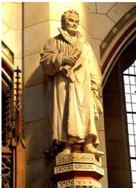
Lutherův spolupra- covník Philipp Melanch- thon

STAR má podle vlastních statistik 200 členů, celosvětově pak 42 tisíc. V posledních letech se představitelé všech tří setkávají a vedou spolu konstruktivní dialog. Přestože se na mnohém shodnou, rozdíly zůstávají nepřekonatelné, což všechny strany respektují. 7