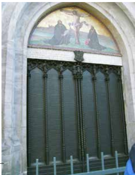
Vrata kostela ve Wittenbergu, na něž Luther přibil 95 tezí

ale vlasti, a stát si dal záležet na tom, aby jim dodal co nejposvátnější a nejzávažnější charakter. Dlouho dopředu se dětem vštěpovalo, že si musejí vybrat buď mezi lojalitou k vlasti, nebo k církvi, potažmo Bohu. Po učitelích se vy-