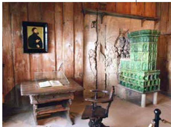
Lutherova pracovna na hradě Wartburg

Proto je dnes potřeba vidět Německo, kolébku evropského adventismu, jako misijní pole, kde je možné sloužit jak Němcům, tak vlastním krajanům, ale také početným skupinám lidí ze zemí, kde adventisté téměř nebo vůbec nejsou – z Turecka, Sýrie, Afghánistánu a dalších. Prostor pro misii mezi nejméně oslovenými národy světa tedy začíná hned za Šumavou a Krušnými horami. A těžko hledat přívětivější misijní pole se všemi výhodami náboženské svobody, schengenského prostoru a vysoké životní úrovně. Je za co se modlit a je co dělat.