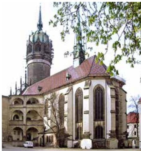
Zámecký kostel ve Wittenbergu, na jehož dveře Luther přibíl 95 tezí

Východoněmečtí křesťané měli víc svobody než jejich souvěrci v ostatních socialistických zemích.